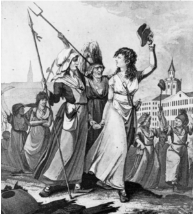
Bewaffnete Marktfrauen, die von einer wohlhabenden Bürgerlichen angeführt werden: Diese Darstellung des Brotmarsches entstand um 1800 und zeigt, wie das Bürgertum rückwirkend einen Anspruch als neue führende Klasse erhob.

sie in Reden, Zeitungsartikeln und Gedichten für ihre Unsittlichkeit. 9 Eine äußerst erfolgreiche Kampagne: Innerhalb kurzer Zeit wurde die Zulassung für Frauen an öffentlichen Veranstaltungen wieder aufgehoben, sämtliche Frauenvereine verboten, und aufmüpfige Frauenrechtlerinnen wanderten ins Gefängnis oder aufs Schafott. Halleluja, die Revolution gehörte wieder den Männern!